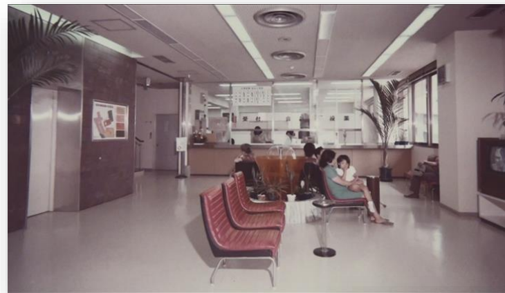
昭和50年頃の杉村病院